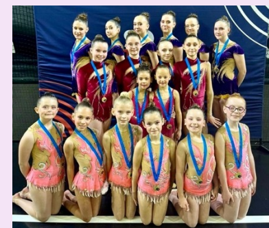
Ensemble Trophée Fédéral A 17 ans et – Ensemble Trophée Fédéral A 13 ans et – Ensemble Trophée Fédéral A 10-11 ans Championnes Régionales Bourgogne Franche-Comté 2024 Qualifiées au Championnat de France 2024 à La Roche sur Foron

Vos idées nous intéressent ! N'hésitez pas à nous contacter !