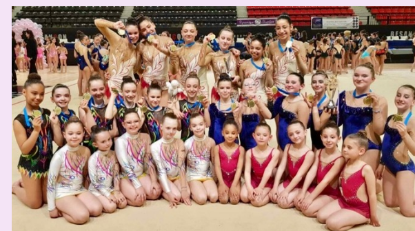
Ensemble 1 Trophée Régional 7-9 ans Ensemble 2 Trophée Régional 7-9 ans 4 ème et 7 ème du Championnat Régional de Bourgogne Franche-Comté 2024 à Besançon

Ensemble Trophée Fédéral B 17 ans et – Ensemble Trophée Fédéral B 13 ans et – Ensemble Trophée Fédéral C 13 ans et – Championnes Régionales Bourgogne Franche-Comté 2024 Qualifiées au Championnat de France 2024 à Pont de Cé