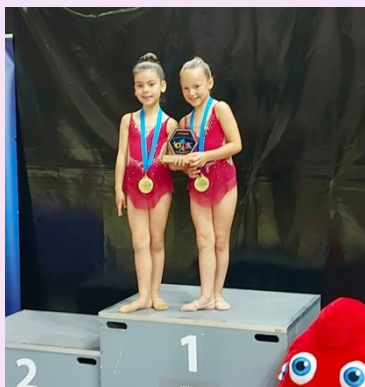
Duo National Performance 7-9 ans Championnes Régionales Bourgogne Franche-Comté 2024 à Lons le Saunier